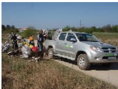
Κατά τη διάρκεια